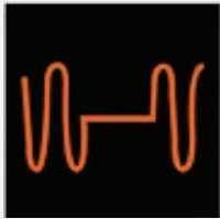
Falta de Energia / Blackouts