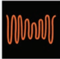
Subtensão Passageira/ Brownouts