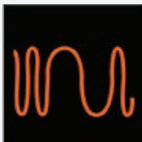
Desvio de Frequência